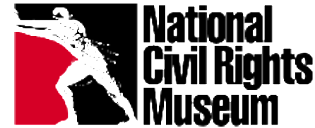
National Civil Rights Museum

Representing Sopot and Gdańsk, we have the following cultural and nonprofit organizations: