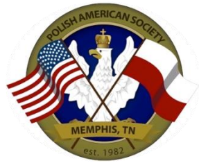
Polish-American Society of Memphis

From Memphis, the following cultural and nonprofit organizations are taking part: