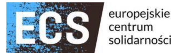
European Solidarity Center