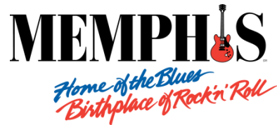
Memphis Convention & Visitor's Bureau