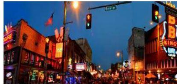
▶ Memphis to także symbol walki z terrorem, walki o prawa człowieka

M emphis w stanie Tennessee, jedno z najbardziej muzycznych miast na świecie. Właśnie tam, na południu USA wychował się i wystartował do kariery Elvis Presley, artysta będący synonimem rock and rolla. Ale na rock'n'rollu muzyczny wkład Memphis w historię świata się nie kończy, miasto jest zasłużone także dla bluesa, jazzu i soulu. Teraz będziemy mogli cieszyć się brzmieniami z Memphis w Trójmieście.